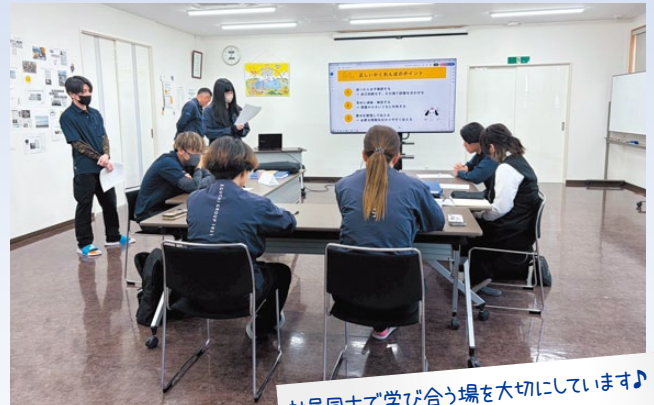
社員同士で学び合う場を大切にしています♪