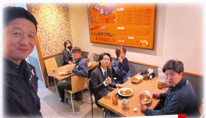
先輩社員と一緒にカレーを食べて楽しいひと時を過ごしました♪

江口組では、知識や技術だけでなく、“人と人とのつながり”も大切にしています。仕事に真剣に向き合うことはもちろん、こうした時間を通してチームワークを育てていく。それが、江口組らしさのひとつです。建設業というと、少し堅いイメージを持たれることもありますが、実際には人のあたたかさを感じられる場面がたくさんあります。「カレーで研修？」そんな一言の裏には、江口組の思いがしっかりと詰まっています。