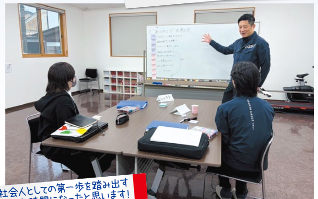
社会人としての第一歩を踏み出す大切な時間になったと思います！