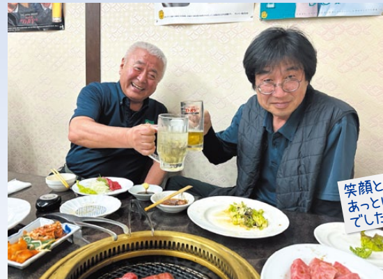
笑顔と会話が広がり、あっといっ間のひとときでした😊

こ うした時間の積み重ねが人と人の繋がりを深め、江口グループが大切にしている和の力へと繋がっていくことを実感しました! そして、その和の力を日々の仕事へと繋げていけるようこれからも取り組んでいきます。