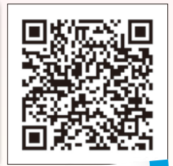
江口組のYouTubeはこちらから!