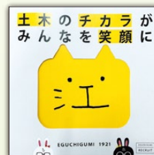
表紙は えぐの顔がドン!

このパンフレットを通じて、江口組の魅力や働く楽しさを、より多くの方に知っていただけたらと思っています。今後、会社説明会やイベントなどで配布予定ですので、ぜひ手に取ってご覧ください!