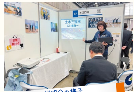
合同説明会の様子 —今年もたくさんの学生さんと出会えますように—

対面での説明会では、現場見学を通じて、社員の働く様子や実際の現場を直接ご覧いただけます。会社説明会への参加を希望する方は、QRコードからお申込みください。また、身近に就職活動を行っている方がいる場合は、この情報をぜひ共有してください! 「こんな会社もあるよ!」と伝えてもらえるだけで、その方の視野が広がるかもしれません。皆さんとお会いできることを楽しみにしています。