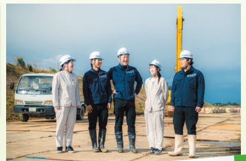
写真撮影の時に撮った1枚 パンフレット内にも掲載されているので探してみてください!

このニュースレターの他に、江口組公式SNSでも頻繁に情報を発信しています。いいね、フォロー、登録を