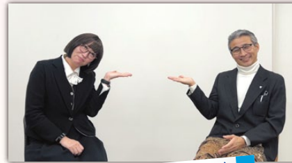
皆さんに早く公開できるように編集頑張ります!

ま た、江口組のYouTube【株式会社江口組】には土木クイズ「土木Q〜!」や江口組のイベント情報をお届けする「NEWS CHIKACO」も公開しています! ぜひ、チェックしてみてください!