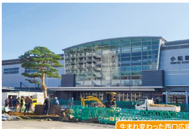
生まれ変わった西口広場

ぼくの担当している小松駅西口広場整備工事もほぼ完成に近づいてきました。シンボルツリーとなる樹齢約100年の大きな赤松がとても印象的です!