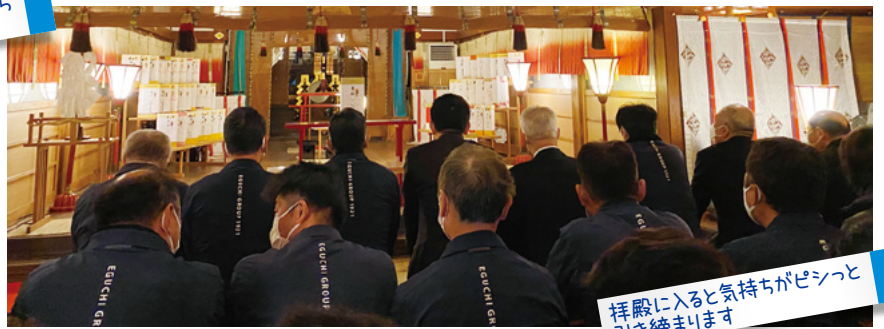
拝殿に入ると気持ちがピシッと引き締まります

新年式では社長が、「今年はうさぎ年なので、飛躍する1年にしよう! そして、新しい挑戦をしながら、社員みんなで力を合わせてがんばろう!」と挨拶をされました。