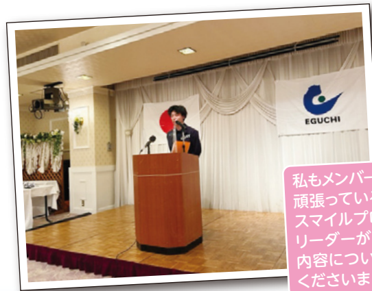
私もメンバーの一員として頑張っている、ESP (江口スマイルプロジェクト) のリーダーが、後半の活動内容について発表をしてくださりました。

江 口グループの皆さん、そしてニュースレターを読んでくださっている皆さんにとって実りのある2023年になりますように★