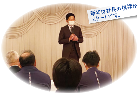
新年は社長の挨拶からスタートです。

先 月5日に、江口グループの2023年がスタートし、その日はみんなと諏訪会館で新年式、菟橋神社で新年祈願をしてきました。