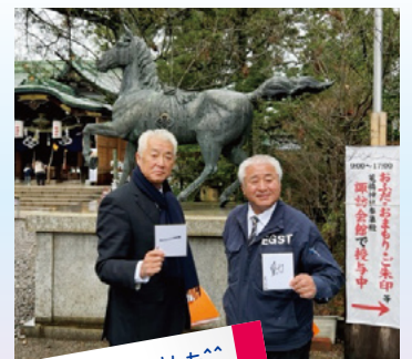
皆さんそれぞれ思い思いの漢字を書かれていました^^

このニュースレターの他に、江口組公式SNSでも頻繁に情報を発信しています。いいね、フォロー、登録を