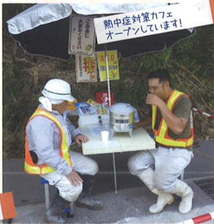
メニューはこちらです

ひ と涼みアワードとは、熱中症予防の啓発活動を審査・表彰する取組で、2012年から毎年秋に開催しています。プロジェクト賛同会員による様々な活動を、会員同士で共有、また国民の皆様へ発信し、熱中症予防の啓発の輪を広げていくことを目的としています。