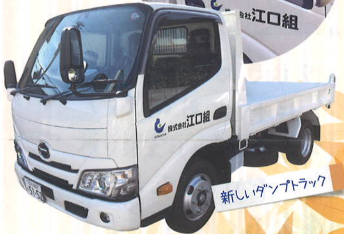
新しいダンプトラック